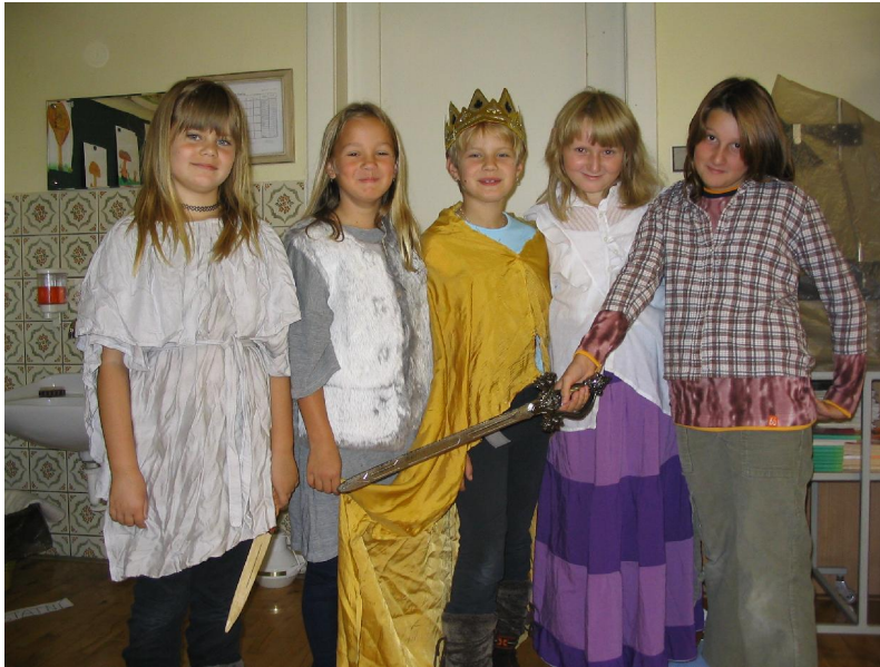
Herci ze 4. třídy si vysloužili dlouhý potlesk

Čtvrťáci upoutali pozornost svých mladších spolužáků moc pěkně zahranou scénkou o Václavově smrti. Potom si děti vyslechly pověst Blaničtí rytíři, v tělocvičně jsme vyzkoušeli zápasy z Václavových dob a odpoledne jsme postavili pro Václava honosné sídlo z krabiček. Děti s chutí splnily i domácí úkol, ve kterém měly zjistit, na které minci je zobrazen svatý Václav. Určitě jim něco o Václavovi v hlavičkách zůstalo.