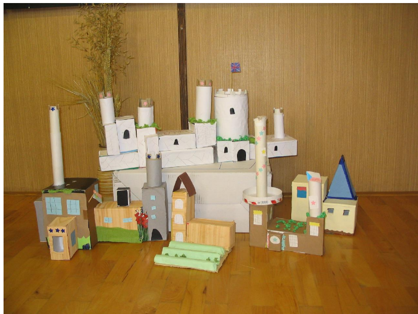
Že by sídlo knížete Václava Pražský hrad ještě bez katedrály?