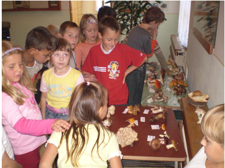
Houbařská výstava ve škole

Hřib je tlustý jak tři prsty. Satan je hořký jako buřty. Kotrč je kudrnatá jak ovečka bílá. Muchomůrka červená je naše krása veliká.